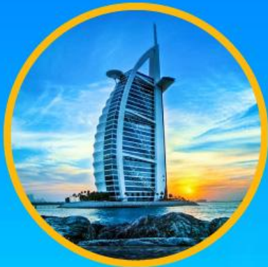
Burj Al Arab