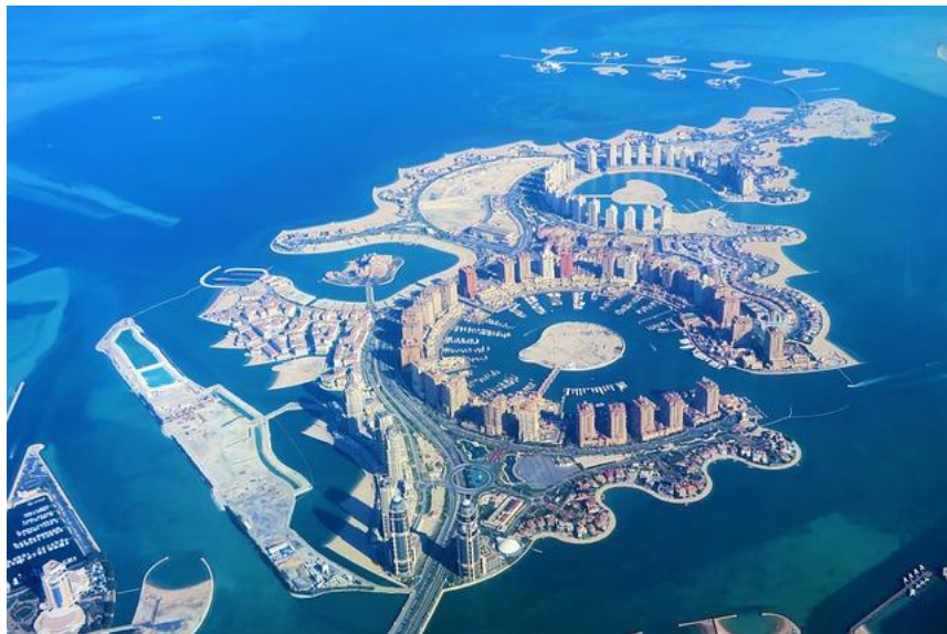
The Pearl Qatar

โดฮา เมืองหลวงของกาตาร์ เป็นเมืองที่มีทั้งความทันสมัยและวัฒนธรรมอันยาวนาน โดฮาขึ้นชื่อเรื่องสถาปัตยกรรมอันโดดเด่น พิพิธภัณฑ์ที่น่าสนใจ ตลาดที่คึกคัก และชายหาดที่สวยงาม