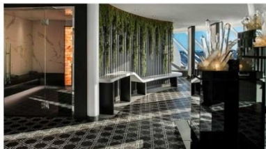
SEA Thermal Suite

Enjoy dining in this exclusive restaurant, featuring inventive dishes crafted by our Michelin-starred chef.