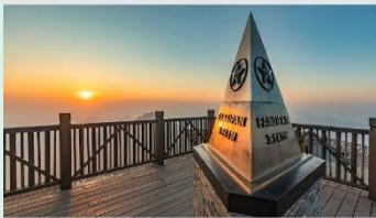
ฟานซิปิน