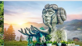
โมอาน่าคาเฟ่

*ทางบริษัทฯ ขอสงวนสิทธิ์ในการสลับโปรแกรมทัวร์ตามความเหมาะสมขึ้นอยู่กับสถานการณ์หน้างาน โดยคำนึงถึงผลประโยชน์ของลูกค้าเป็นสำคัญ