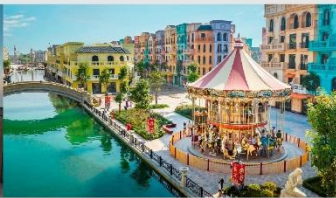
Mega Grand World