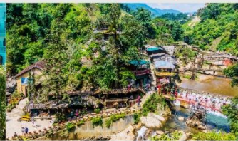
หมู่บ้านก๊ต ก๊ต