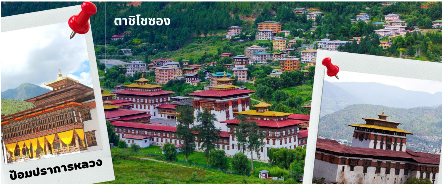
ตาชิโชซอง

นำท่านเดินทางสู่ เมืองทิมพู เมืองหลวงของประเทศภูฏานตั้งแต่ปี ค.ศ. 1961 ใช้เวลาการเดินทางประมาณ 1 ชม. นำท่านเดินทางเข้าชม ตาชิโชซอง มหาปราสาทแห่งศาสนาและวิหารหลวงแห่งเมืองทิมพู (วันธรรมดาเปิดหลัง 16.30น. / เสาร์-อาทิตย์ เปิดทั้งวัน) ตาชิโชซอง หมายถึง ป้อมแห่งศาสนาอันเป็นมงคล สร้างในสมัยศตวรรษที่ 12 โดย ท่านซัปดรุง งาวัง นัมเกล ปัจจุบันเป็นสถานที่ทำงานของพระมหากษัตริย์ สถานที่ทำการของกระทรวงต่างๆ และวัด รวมทั้งเป็นพระราชวังฤดูร้อนของพระสังฆราช และบริเวณอันใกล้ท่านจะได้เห็นวังที่ประทับส่วนพระองค์ของพระราชาริบดีจิกมีด้วย