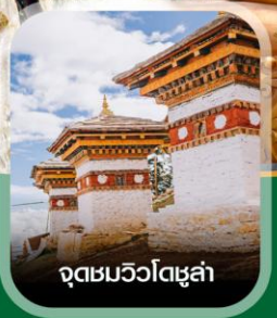
จุดชมวิวดโซลา

คอนเฟิร์ม ออกเดินทาง ทุกพีเรียด 2 ท่านขึ้นไป