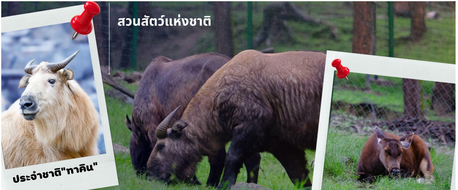
สวนสัตว์แห่งชาติ

เที่ยง รับประทานอาหารเที่ยง ณ ภัตตาคาร (มื้อที่ 7) นำท่านชม สวนสัตว์แห่งชาติของประเทศภูฏาน และชมสัตว์ประจำชาติ ทาคิน ที่มีรูปร่างลักษณะพิเศษผสมระหว่างแพะกับวัว มีแห่งเดียวในประเทศภูฏานเท่านั้น ซึ่งครั้งหนึ่งประเทศสหรัฐอเมริกาเคยเจรจาขอไปเลี้ยงแต่ได้รับการปฏิเสธจากรัฐบาลประเทศภูฏาน ทาคิน เป็นสัตว์ในตำนานประวัติศาสตร์ของศาสนาพุทธ โดยเชื่อว่าท่านลามะ Drukpa Kunley เป็นผู้สร้างขึ้นจากกระดูกของแพะและวัวที่ท่านได้ทานเป็นอาหาร กองกระดูกก็กลับมามีชีวิตอีกครั้งกลายเป็น ตัวทาคิน ที่มีลักษณะคล้ายกับแพะและวัวผสมกัน