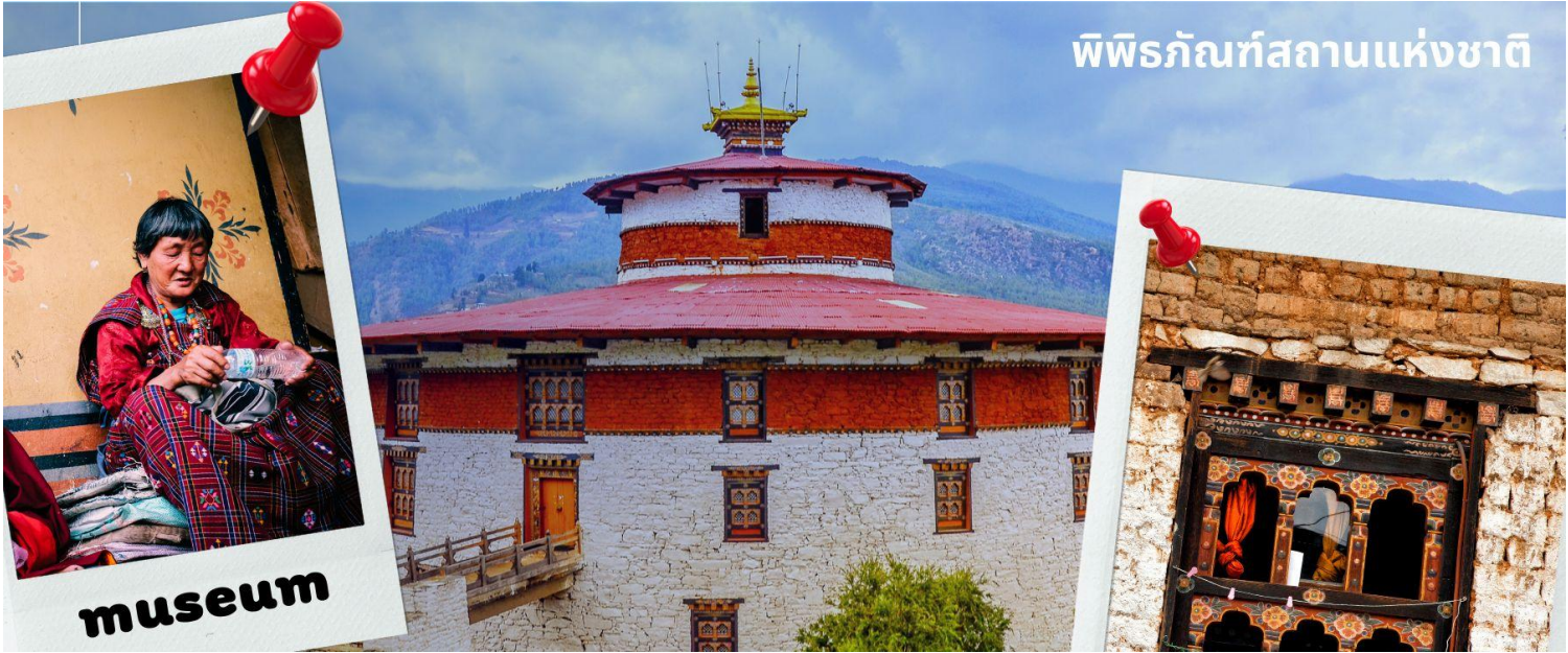
พิพิธภัณฑสถานแห่งชาติ

นำท่านเดินทางไม่ไกล ชม พิพิธภัณฑสถานแห่งชาติ พิพิธภัณฑสถานแห่งนี้เป็นที่เก็บรวบรวมหน้ากากศิลปะแบบพุทธมหายาน นิกายตันตระ ภาพพระบฏ อวรุท เหริยญกษาปณ์ เครื่องมือเครื่องใช้ไม้สอยต่างๆ รวมถึงจัดแสดงความหลากหลายทางธรรมชาติอันสมบูรณ์ของประเทศเพื่อให้ทุกท่านได้รู้จักภูมิกานมากขึ้น ตรงข้ามกับอาคารพิพิธภัณฑสถานเป็นอาคารทรงกลมสีขาว เรียกว่า ตาซอง (Ta Dzong) หรือหอคอย เดิมใช้เป็นหอสังเกตการณ์ข้าศึกศัตรูเนื่องจาก สร้างอยู่บนเนินสูง สามารถมองวิวตัวเมืองพาโรได้โดยรอบ