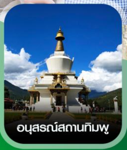
อนุสรณ์สถานทิมพู