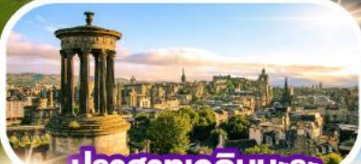
ปราสาทอดินบะระ