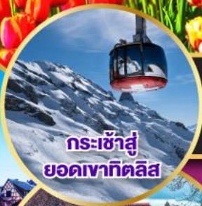
กระเช้าสู่ยอดเขาทิตลิส