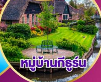
หมู่บ้านทีธูร์น