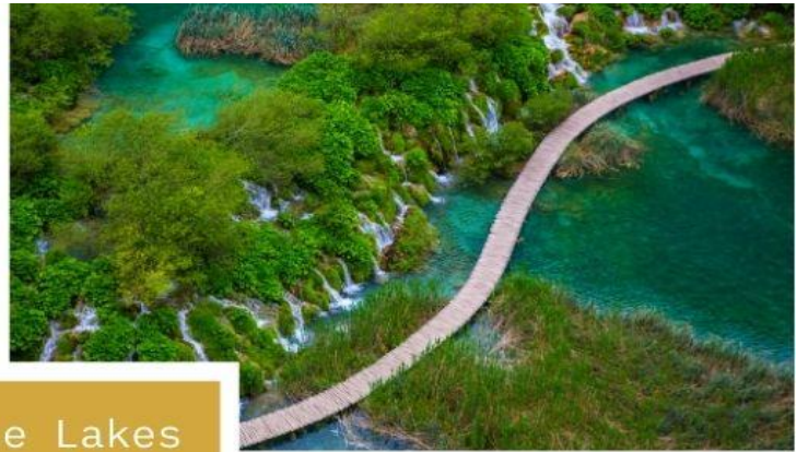
Plitvice Lakes National Park