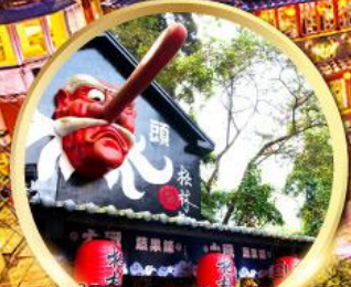
หมู่บ้านปิตาจชิโกว