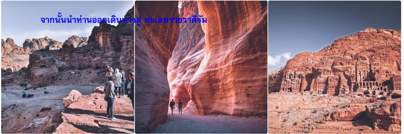
จากนั้นนำท่านออกเดินทางสู่ ทะเลทรายวาดีรัม

ค่า รับประทานอาหารค่ำ ณ แคมป์ที่พัก ที่พัก LUXURY RUM MAGIC CAMP (BUBBLE TENT) หรือเทียบเท่า