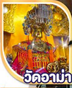
วัดอาน่า