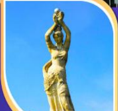
จูไห่พีซเซอร์กิส