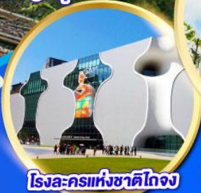
โรงละครแห่งชาติไต้หวัน