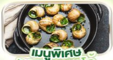
เมนูพิเศษ หอยแอสคาโก้

พิเศษ ล่องเรือแม่น้ำแซนชมเมือง โดย บาโต มูช