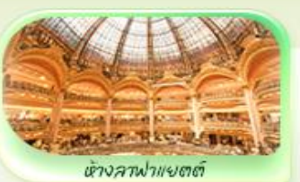
ห้องคาเฟ่