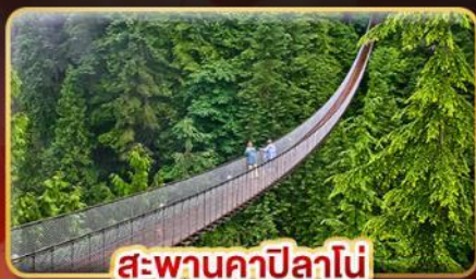
สะพานคาปิลานี