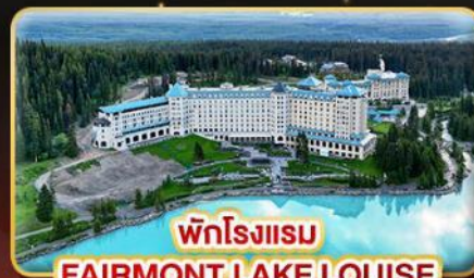
พักโรงแรม FAIRMONT LAKE LOUISE