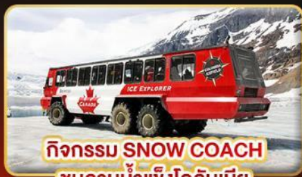
กิจกรรม SNOW COACH ชมลานน้ำแข็งโคลิมเบีย