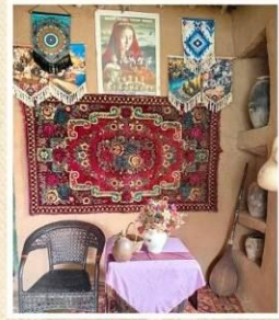
หมู่บ้านอูยกูร์