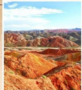
ภูเขาสายรุ้งต้นเซีย