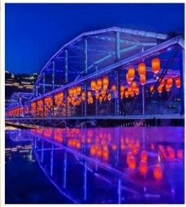
สะพานหวงเหอ ตี้อี้เจี๋ยว