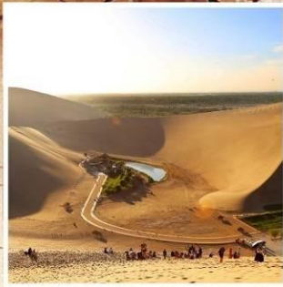
สะพานน้ำองพระจันทร์