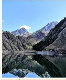
ทะเลสาบเทียนฉือ