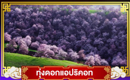
ทุ่งดอกแอปริคอต