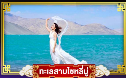
ทะเลสาบโซหลูมู