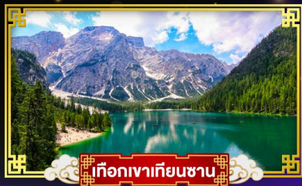
เทือกเขาเทียนชาน