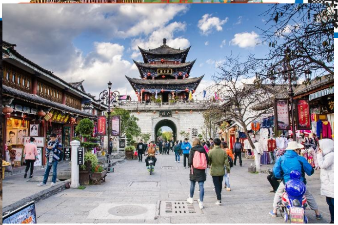
นำท่านเที่ยวชม วัดเจ้าแม่กวนอิม ตามตำนานแล้วว่า

เจ้าแม่กวนอิมได้แปลงกายเป็นหญิงชราแบกก้อนหินใหญ่ไว้บนหลังเพื่อให้ทหารของฝ่ายตรงข้ามได้เห็นเมื่อทหารของฝ่ายศัตรูได้เห็นว่ามีแม่แต่หญิงชรายังแข็งแรงถึงเพียงนี้ถ้าเป็นคนวัยหนุ่มสาวจะต้องมีพลังมากมายยากจะต่อสู้จึงไม่ได้ทำการเข้าโจมตีเมืองและถอยทัพกลับไปชาวเมืองจึงสร้างวัดแห่งนี้ขึ้นในสมัยราชวงศ์ถังเป็นวัดที่มีประติมากรรมเยี่ยมยอดแห่งหนึ่งในต้าหลี่