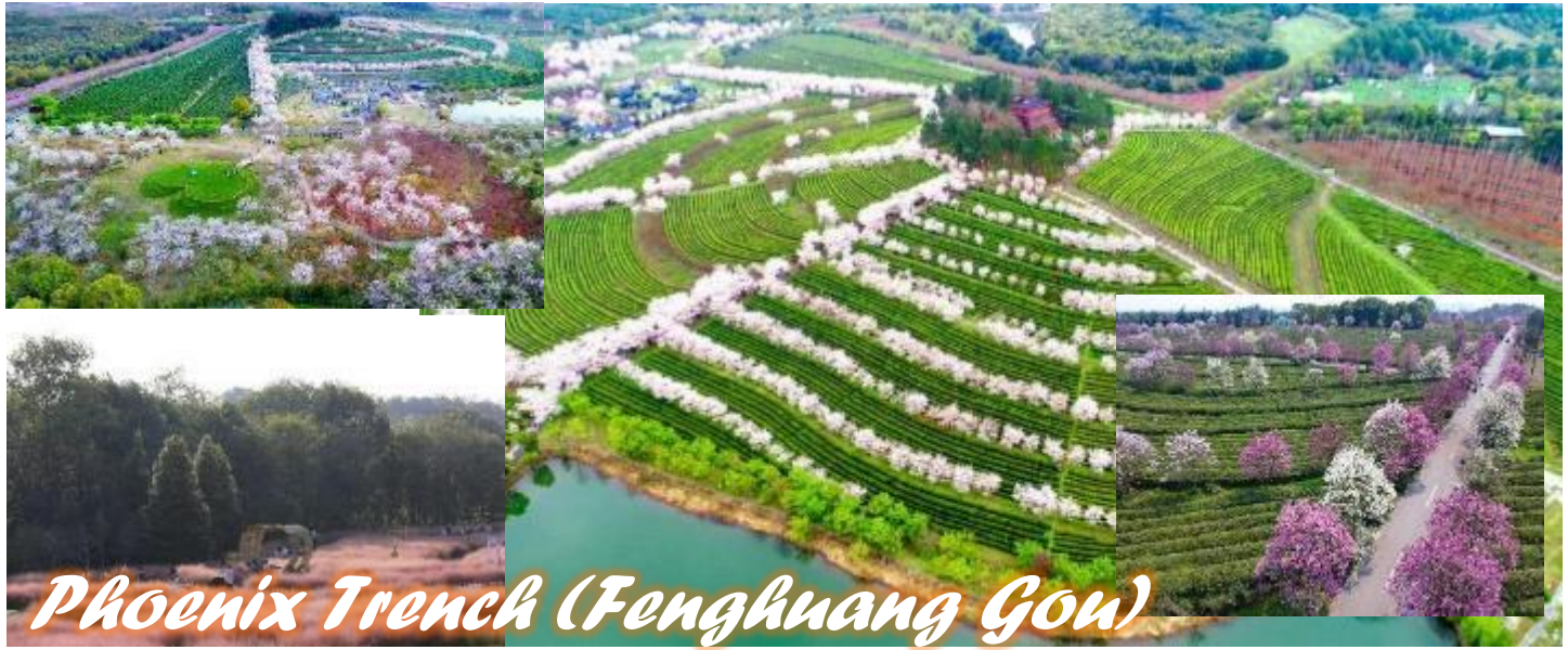
Phoenix Trench (Fenghuang Gou)

ร่องวิหคเพลิง(เฟิ่งหวงโกว) เนื่องจากตั้งอยู่ในตำบลหวงหมา อำเภอหนานซาง มณฑลเจียงซี จึงมีอีกหลายชื่อเรียกตามสถานที่ตั้งอย่าง หวงหมาเฟิ่งหวงโกว หรือหนานซางเฟิ่งหวงโกว ซึ่งหากทุกท่านได้ยืนให้ทราบไว้ว่าเป็นจุดเดียวกันนั่นเอง