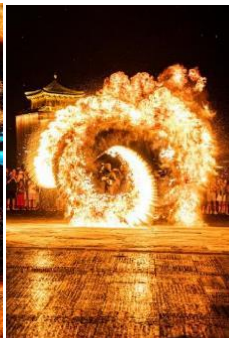
Melted Metal-Firework Show

นำท่านชม โชว์ดอกไม้ไฟเหล็กหลอม การแสดงทางวัฒนธรรมที่จับต้องไม่ได้ “ดอกไม้ไฟเหล็กหลอม” เป็นการจำลองพลุที่อยู่บนท้องฟ้ามาอยู่ในระดับสายตาให้เหล่าผู้ชมได้สัมผัสได้สัมผัสความอลังการด้วยแสง สี และความสวยงามอันน่าทึ่งของ 1 ในวัฒนธรรมจีนที่สืบทอดกันมาในแถบพื้นที่ตอนใต้ของแม่น้ำเหลือง(ฮวงโห) การแสดงดอกไม้ไฟเหล็กหลอม เกิดขึ้นมายาวนานกว่าพันปีแล้ว โดยช่างตีเหล็กได้ค้นพบความงามหลุดจินตนาการนี้จากการทดลองโยนเหล็กหลอมสาดขึ้นสู่ท้องฟ้า ซึ่งหากมองจากไกลๆ จะดูเหมือนประกายไฟสีทองอันแสนงดงาม และยังเปรียบเหมือนกับดวงดาวที่ลอยเต็มฟ้า ซึ่งเป็นแนวความคิดที่คล้ายกับดอกไม้ไฟในปัจจุบันนั่นเอง และด้วยการพัฒนาไปไกลของยุคสมัย ทำให้สามารถจัดแสดงได้ด้วยความปลอดภัยไม่เป็อันตรายอย่างแต่ก่อนที่ต้องอาศัยผู้เชี่ยวชาญถึงสามารถจัดการแสดงนี้ขึ้นได้ ดอกไม้ไฟเหล็กหลอมมักจัดแสดงขึ้นในเทศกาลตรุษจีน เพื่อเฉลิมฉลองการขึ้นปีใหม่ของจีนด้วยความยิ่งใหญ่ ตระการตาและยังถือเป็นการแสดงเพื่ออวยพรให้เกิดความเป็นสิริมงคลนั่นเอง (หากมีฝนตกจะไม่สามารถชมการแสดงได้)