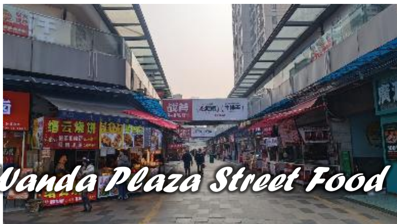
Wanda Plaza Street Food

พาทุกท่านมาเยือนจุดหมายสุดท้ายก่อนเดินทางกลับไทย สตรีทฟู้ดห้างวันต้า พลาซ่า (Wanda Jinjie Street food) เมืองหนานชาง ให้ทุกท่านได้แวะพักผ่อน ชื้อของฝากกันให้จุใจกับห้างอันดับต้นๆ ในเมืองหนานชาง