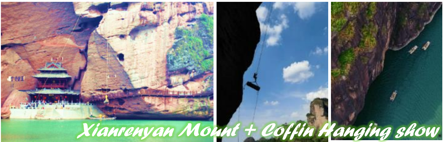
Xianrenyan Mountain + Coffin Hanging show

เมืองโบราณแห่งนี้มีชื่อเสียงในฐานะแหล่งกำเนิดลัทธิเต๋าในประเทศจีน จางเทียนชื้อและลูกหลานของท่านอาศัยอยู่ที่นั่นมาเป็นเวลา 63 ชั่วอายุคนและยาวนานกว่า 1,900 ปี ทำให้เมืองซางซิงเป็นที่รู้จักในฐานะ "เมืองเต๋าอันดับ 1 ของจีน" หนึ่งในจีนและต่างประเทศ