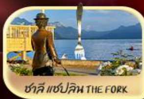
ซาลี แฮปป์ลิน THE FORK