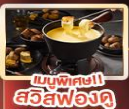
เมนูพิเศษ!! สวิสฟองดู

เบิร์น เวอรัย เซอร์แมท อินเทอร์ลาเกน ทิตลิส ลูเซิร์น ซูริก