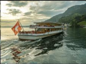
ล่องเรือชมวิวกทะเลสาบลูเซิร์น