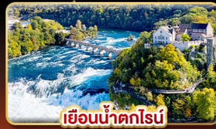
เขื่อนน้ำตกโรน