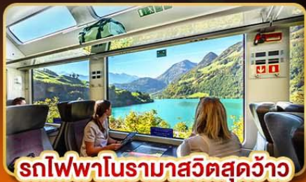
รถไฟฟ้าโรมาสวิตสุดจ้าว

📅 เดินทาง 14- 21 เม.ย. | 09-16 พ.ค. | 30-06 มิ.ย. 68