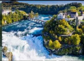
เขื่อนน้ำตกโรน