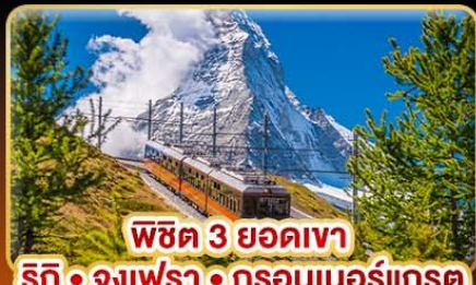
พีชิต 3 ยอดเขา ริทึ • จุงเฟรา • กรอนเนอร์เกรต