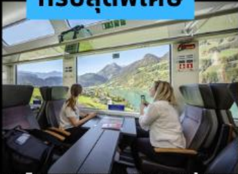
รถไฟ Panarama วิวดูทิวทัศน์