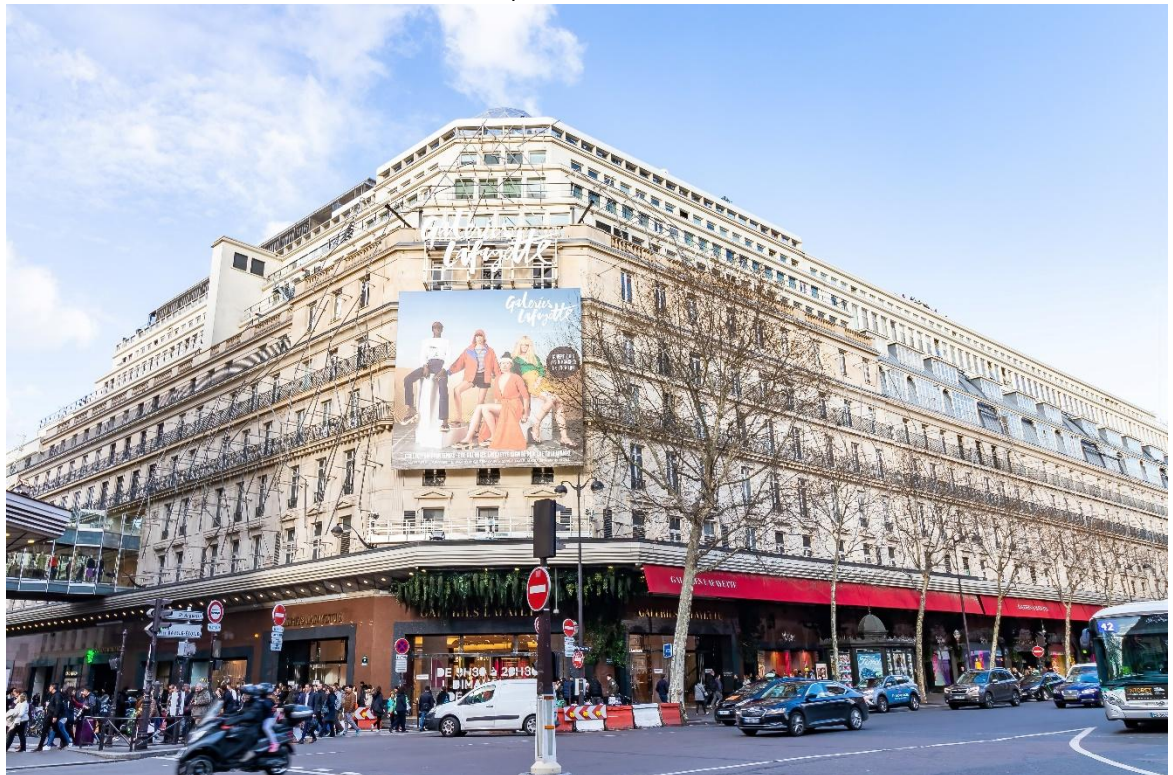
พักที่ MERCURE PARIS LE BOURGET , CDG PARIS ระดับ 4 ดาวหรือเทียบเท่า

นำท่านช้อปปิ้ง ห้างแกลเลอรี ลาฟาแยตต์ (GALERIES LAFAYETTE) ห้างหรูที่มีชื่อเสียงมากที่สุดแห่งหนึ่งของปารีส ภายในอาคารที่มีสถาปัตยกรรมที่สวยงาม ช้อปปิ้งแบรนด์เนม ห้างนี้มีเอกลักษณ์ที่มีความโดดเด่นอย่างมาก โดยเฉพาะหลังคาโดมภายในตัวโถงอาคาร มีการตกแต่งประดับดาอย่างสวยงาม ลักษณะโดมเป็นโครงเหล็กประดับกระจกสี มีลวดลายสโตร์อาร์ตนูโว (ผู้ออกแบบ ART NOUVEAU) ซึ่งเป็นแนวศิลปะที่นิยมกันมากในฝรั่งเศสช่วงปลายคริสต์ศตวรรษที่ 18 การตกแต่งของอาคารโดยรอบใช้ลวดลายปูนปั้นและราวระเบียงโค้ง อันเป็นทัศนียภาพที่งดงามต่อเมืองท่องเที่ยวอย่างปารีส เป็นห้างสรรพสินค้านี้มีลูกค้าที่เป็นนักท่องเที่ยวชาวต่างชาติมารวมกันอยู่เยอะมาก มีสินค้าต่างๆที่ทันสมัยให้เลือกซื้อได้อย่างจุใจไม่ตกเทรนด์ เรียกได้ว่าอะไรใหม่ๆมา GALLERIES LAFAYETTE นั้นจะมีขายก่อนก่อนห้างอื่นเสมอ ไม่ว่าจะเป็น เสื้อผ้า กระเป๋า รองเท้า น้ำหอม มีครบทุกยี่ห้อ