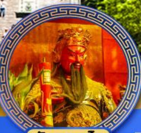
วัดกวนไท่