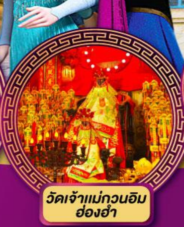
วัดเจ้าแม่กวนอิม อ่องฮ่า