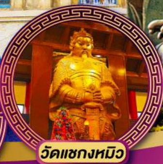
วัดเขกหมิว