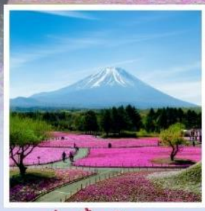
ทุ่งพืชมอส