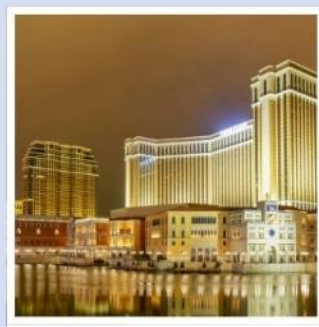
เดอะ เวเนเชียน

เทศกาลชิบะซากุระ ชมทุ่งพืชมอส ชมดอกไม้สีชมพูคู่ฟูจิ ฮาคุบะอิวาตาคะ ระเบียงกระจก จุดไฮไลท์ที่สวยงามที่สุดแห่งฮาคุบะ สะพานคัปปะ ไฮไลท์แห่งหุบเขาคามิโคจิที่พลาดไม่ได้ ไม่พลาดกับของฝาก ช้อปปิ้งจุกในชินจูกุและอิออน พลาซ่า กราบไหว้ขอพรกับเทพเจ้าองค์ไต่สวยเอ๊ย วัดเปากง สัมผัสความอลังการของ เดอะ เวเนเชียน รีสอร์ทระดับเวิลด์คลาส พักออนเซ็น 1 คืน!!! // อาหารพิเศษ...บุฟเฟ่ต์ซาบูยักซ์, บุฟเฟ่ต์ซาบู กรุ๊ปสบายๆ เพียง 25 ท่านเท่านั้น!!!