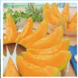
ศูนย์จำหน่ายเมล่อนยูบาริ