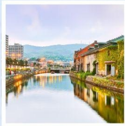
เมืองโอตารุ