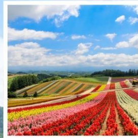
สวนดอกไม้ซิกิโซโนะโอกะ