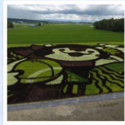
ศิลปะบนนาข้าว