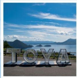
จุดชมวิวจิโฮ

ชมวิวที่สวยงามที่สุดบนทะเลสาบโทยะ ณ จุดชมวิวจิโฮ เมืองสุดแสนโรแมนติก กับถนนสายของหวานชื่อดัง โอตารุ ศิลปะบนนาข้าว เรื่องราวในทุ่งนาสะท้อนจิตวิญญาณแห่งฮอกไกโด ที่ 1 ปี มีครั้งเดียว กิน กิน และ กิน จูใจไปกับเมล่อนเย็นฉ่ำแบบไม่ฉ่ำ ชมฟาร์มโคนมชื่อดัง นิเซโกะ ทาคาฮาชิ กับวิวโยเทแสนพิเศษ สวนดอกไม้กับวิวเทือกเขาที่โด่งดังที่สุดแห่งฮอกไกโด ณ สวนซิกิโซโนะโอกะ พักออนเซ็น 1 คืน!!! พักในเมืองชิโปโร 2 คืน เมฆพิเศษ...บุฟเฟ่ต์เมล่อน, บุฟเฟ่ต์ซาปู, บุฟเฟ่ต์ซาบู, บุฟเฟ่ต์บึงย่าง กรุ๊ปสบายๆ เพียง 20 ท่านเท่านั้น!!!