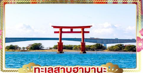
ทะเลสาบฮามานะ

เดินทางโดยสารการบินไทยแอร์เวย์ อาหาร : 10 มื้อ โรงแรม : 3 ดาว