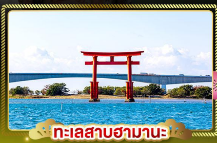
ทะเลสาบฮามานะ