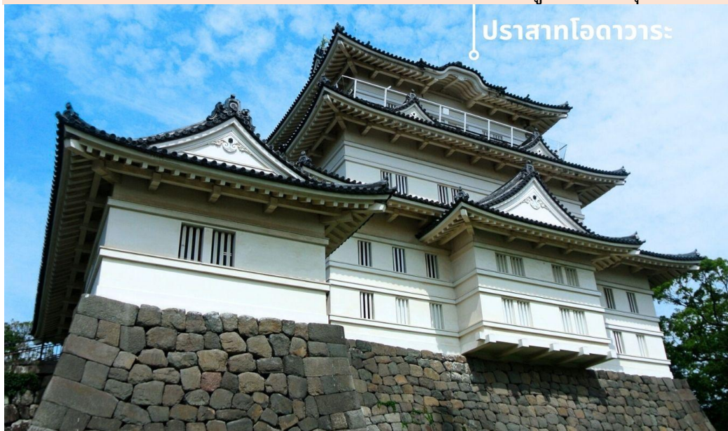
ปราสาทโอดาวาระ

** ระยะเวลาการบานของดอกไม้จะขึ้นอยู่กับสายพันธุ์และสภาพอากาศ **