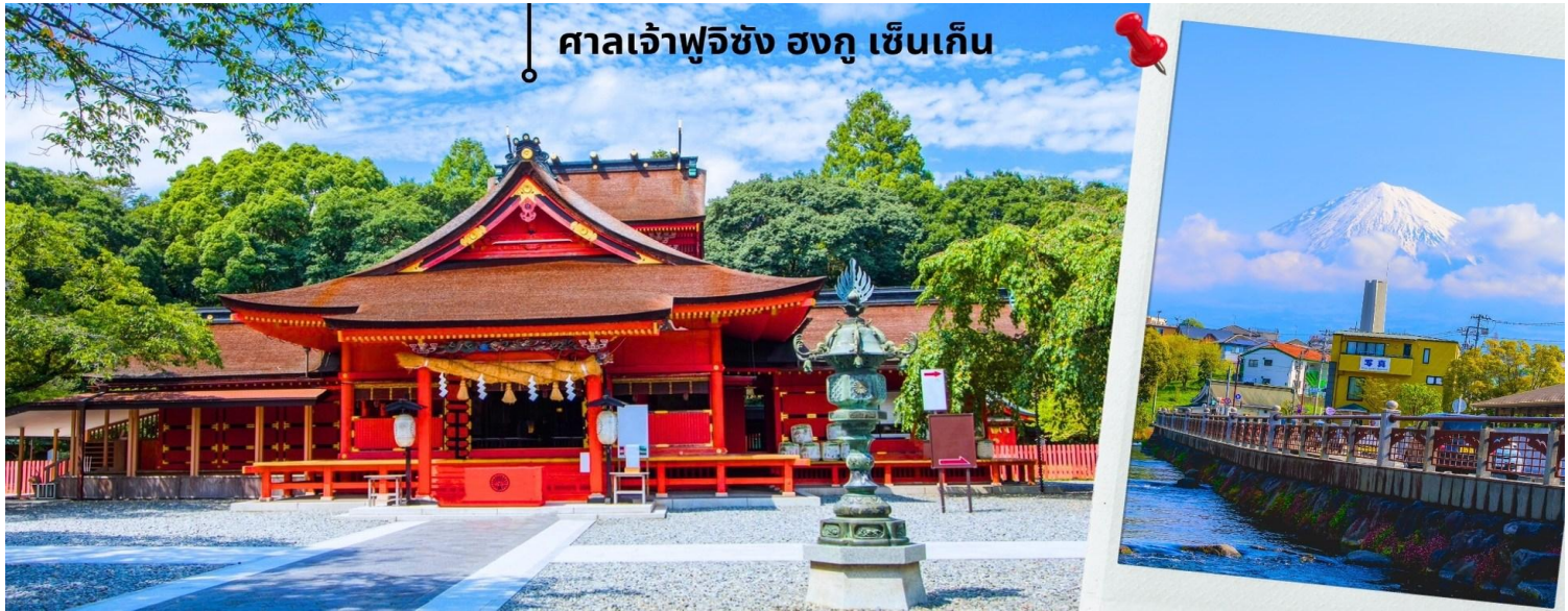
ศาลเจ้าฟูจิซัง ฮงกุ เซ็นเก็น

จากนั้นนำท่านไปสักการะ ศาลเจ้าฟูจิซัง ฮงกุ เซ็นเก็น ไทชะ (Fujisan Hongu Sengen Taisha) ศาลเจ้าอายุเก่าแก่กว่า 1,000 ปี สร้างขึ้นเพื่อเป็นการบวงสรวงเทพเจ้าของภูเขา เพื่อให้หยุดการปะทุของภูเขาไฟฟูจิในช่วงที่มีการระเบิด ถือเป็นศาลเจ้าที่สำคัญที่สุดของภูมิภาค นอกจากนี้ศาลเจ้าฟูจิซัง ฮงกุ เซ็นเก็น ไทชะ ยังเป็นส่วนหนึ่งของมรดกโลกทางวัฒนธรรมภูเขาฟูจิ