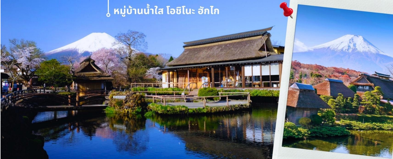
หมู่บ้านน้ำใส โอชิโนะ ฮักไก

พอสสมควรแก่เวลานำท่านสู่ หมู่บ้านน้ำใส โอชิโนะ ฮักไก (Oshino Hakkai) ถือเป็นหมู่บ้านแห่งการท่องเที่ยวที่ยังคงความอุดมสมบูรณ์ของธรรมชาติเอาไว้ได้อย่างดีในหมู่บ้านมีบ่อน้ำใสที่เป็นน้ำที่ละลายมาจากหิมะบนภูเขาไฟฟูจิที่มีความสวยงามในระดับที่ว่าได้รับการขึ้นทะเบียนให้เป็นมรดกทางธรรมชาติในปีค.ศ. 1934 และได้รับคัดเลือกให้เป็นหนึ่งในภูมิทัศน์ทางน้ำที่งดงามในปีค.ศ. 1985 อีกด้วยและยังเป็นอีกหนึ่งสถานที่ที่เราสามารถมองเห็นวิวฟูจิด้วยหาววันนั้นเป็นวันที่ฟ้าเปิด