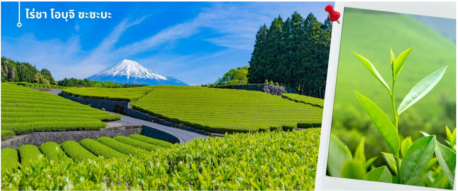
ไร่ชา โอบุจิ ซะซะบะ

เที่ยว รับประทานอาหารเที่ยง ณ ภัตตาคาร (5) หลังรับประทานอาหารเที่ยง นำท่านเดินทางสัมผัสบรรยากาศไร่ชาสโตร์ญี่ปุ่น “มัทฉะ (Matcha)” เป็นรสชาติที่ได้รับความนิยม มีต้นกำเนิดอยู่ในญี่ปุ่น ผลิตขึ้นจากชาเขียวหรือที่เรียกว่า “เรียวกุฉะ (Ryokucha)” และสถานที่ซึ่งเป็นแหล่งผลิตชาเขียวที่มีชื่อเสียงแห่งหนึ่งในญี่ปุ่น ไร่ชาโอบุจิ ซะซะบะ (Obuchu Sasaba) ตั้งอยู่ใกล้กับภูเขาไฟฟูจิ ในจังหวัดชิซุโอกะ (Shizuoka) ที่รู้จักกันดีว่าเป็นภูมิภาคที่มีการผลิตชาชั้นนำของประเทศญี่ปุ่น ไร่ชาแห่งนี้โดดเด่นในเรื่องของวิวทิวทัศน์ที่สวยงาม ในวันที่ฟ้าเปิด จะสามารถมองเห็นภูเขาไฟฟูจิได้อีกด้วย บรรยากาศที่สวยงามกับไร่ชาสีเขียว พร้อมกับพื้นหลังเป็นภูเขาไฟฟูจิ ให้ท่านได้อิสระเก็บภาพบรรยากาศภายในไร่ชา ตามอัธยาศัย