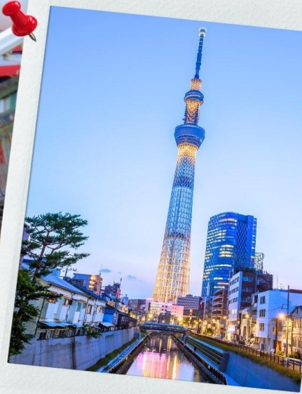
วัดอาซากุสะ และ โตเกียวสกายทรี

เที่ยง รับประทานอาหารเที่ยง ณ ภัตตาคาร เมนูพิเศษ!! SHABU SHABU เซ็ตสไตล์ญี่ปุ่น (2)