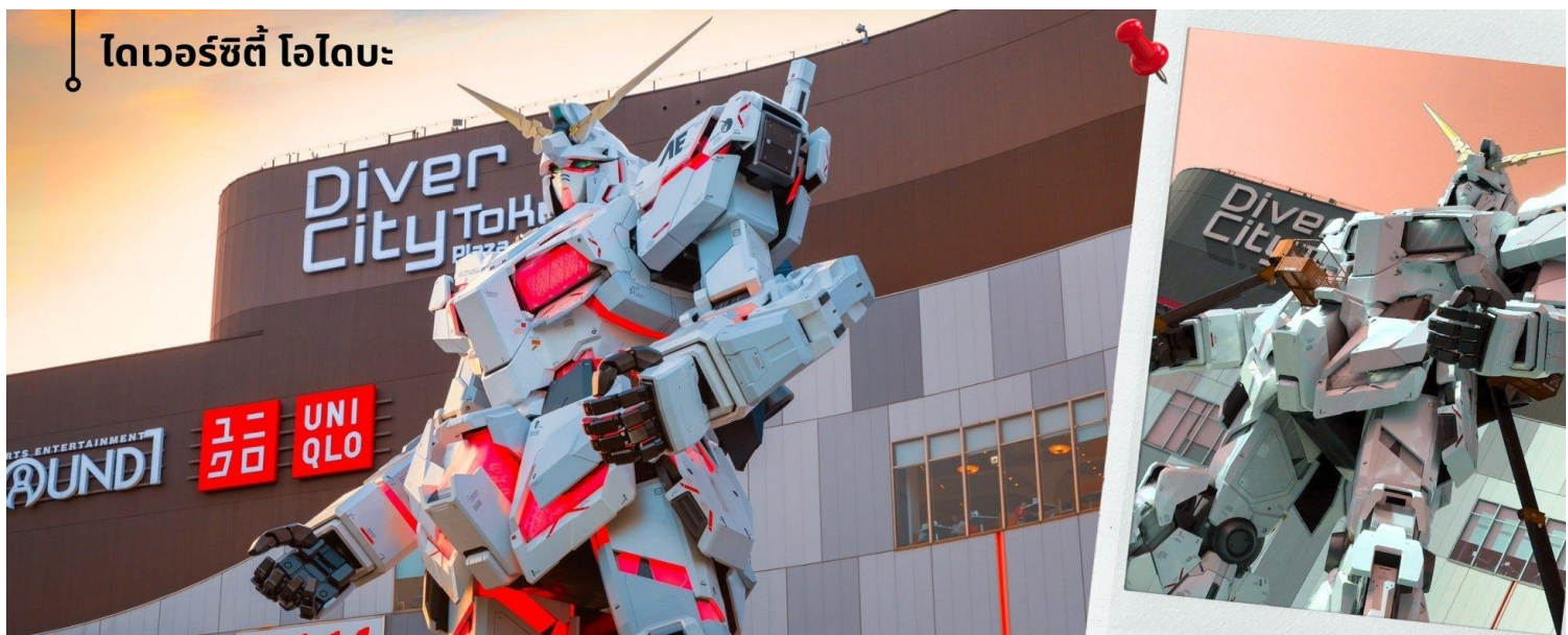
ไทเวอร์ซิตี โอโดบะ

จากนั้นนำท่านสู่ ไทเวอร์ซิตี โอโดบะ (Diver City Plaza) เป็นเกาะจำลองขนาดใหญ่ ซึ่งสร้างขึ้นจากการถมทะเลบริเวณอ่าวโตเกียว เติบโตขึ้นอย่างรวดเร็วในฐานะเขตท่าเรือจนถึงช่วงทศวรรษที่ 1990 โอโดบะ ได้กลายเป็นย่านการค้ามีห้างสรรพสินค้าขนาดใหญ่ที่พิกอศัยและแหล่งบันเทิงขนาดใหญ่โตแห่งหนึ่งให้ท่านได้ชม Unicorn Gundam หุ่นกันดั้มตัวใหม่เป็นรุ่น RX-0 Unicorn Gundam ในโหมด Destroy เป็น หุ่นสีขาว-แดงมีความสูงประมาณ 24 เมตรสูงกว่าหุ่นตัวเดิมถึง 6 เมตร และซ้อปิ้งตามอัยาศัย