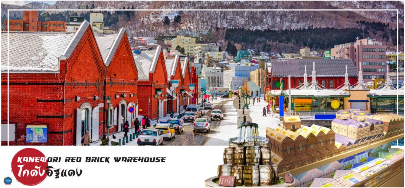
KANEMORI RED BRICK WAREHOUSE โกดังอิฐแดง

เช้า รับประทานอาหารเช้า ณ ห้องอาหารของโรงแรม ( JAPAN SET ) (2) นำท่านเดินทางสู่ ตลาดเช้าฮาโกดาเตะ (Hakodate Morning Market) (ใช้เวลาเดินทางประมาณ 10 นาที) อันแสนพลุกพล่านที่คอยช่วยชวนนักท่องเที่ยวให้เข้าไปเลือกซื้อของสดๆ ชั้นดีจากฮาโกดาเตะ ตลาดเช้าเริ่มเปิดขายแต่เช้าตรู่ตั้งแต่เวลาตีห้า (หกโมงเช้าหากเป็นฤดูหนาว) และปิดเวลาเที่ยง อาหารทะเล ผักผลไม้และขนมหวานเป็นเพียงส่วนหนึ่งของของกินที่วางขายเท่านั้น เพลิดเพลินไปกับการซื้อของที่ตลาดและอย่าลืมแวะไปดูปูและหอยเป็นๆ ในตู้ขนาดยักษ์ จากนั้นนำท่านสู่ ท่าเรือเมืองฮาโกดาเตะ หรือ ย่านเมืองเก่าโมโตมาชิ (Motomachi District) เป็นท่าเรือแรกที่เปิดให้มีการค้าระหว่างประเทศในปี 1854 ในช่วงสิ้นสุดยุคญี่ปุ่นแบ่งแยก ดังนั้นทำให้มีผู้ค้าจำนวนมากจากรัสเซีย จีน และประเทศตะวันตก ได้ย้ายถิ่นฐานมาอาศัยอยู่ในเมืองฮาโกดาเตะ บริเวณฐานภูเขาฮาโกดาเตะ ส่งผลให้ฮาโกดาเตะได้รับอิทธิพลต่างๆมาจาก ชาวตะวันตก โดย ปัจจุบันยังคงมีอาคารสไตล์ต่างประเทศคงเหลืออยู่ สะท้อนให้เห็นวัฒนธรรมของเมืองนี้ได้เป็นอย่างดี และอิสระให้ท่านเดินเล่น ณ โกดังอิฐแดงริมน้ำ (Red Brick Warehouses) ได้ปรับปรุงมาจากคลังสินค้าอิฐสีแดงที่เคยใช้ค้าขายในปลายสมัยเอโดะ ตั้งอยู่ริมแม่น้ำของอ่าวฮาโกดาเตะ ศูนย์รวมแหล่งช้อปปิ้ง ร้านอาหาร และสถานบันเทิงที่ให้บริการเก๋ๆ นอกจากร้านขายของที่ระลึกที่ทันสมัย เสื้อผ้าแฟชั่น ร้านขายอุปกรณ์ตกแต่งบ้าน และร้านขนมหวานแล้ว ยังมีร้านอาหาร ลานเบียร์ โบสถ์สำหรับจัดพิธีแต่งงาน และบริการล่องเรือเพื่อชมวิวทิวทัศน์ของอ่าวฮาโกดาเตะอีกด้วย เที่ยง รับประทานอาหารกลางวัน ณ ภัตตาคาร (3)