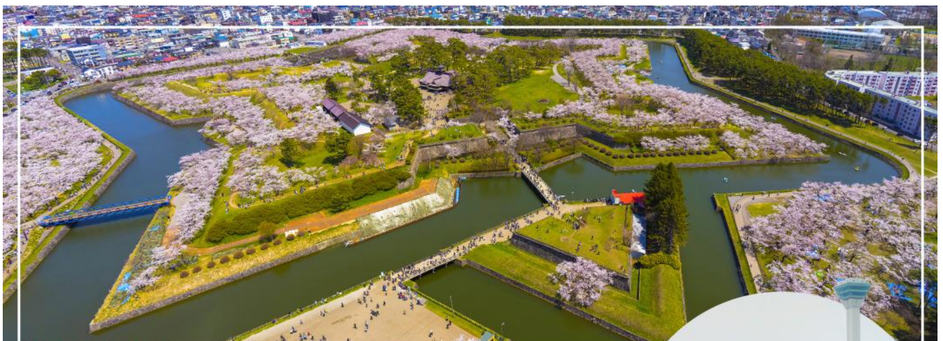
FORT GORYOKAKU ป้อมโกเรียวกาคู

จากนั้นนำท่านสู่ ทะเลสาบโทยะ (Toya Lake) (ใช้เวลาเดินทางประมาณ 2.30 ชั่วโมง) เมืองที่โอบล้อมไปด้วยความสวยงามของธรรมชาติ ล้อมรอบไปด้วยภูเขาไฟ ทะเลสาบ ที่มีทัศนียภาพสวยงามน่าจดจำ ถ้าหากมาเที่ยวในจังหวัดฮอกไกโด