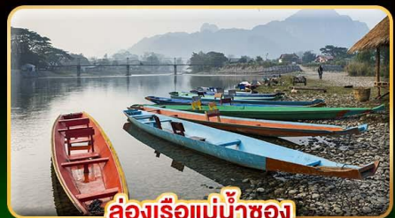
ล่องเรือแม่น้ำซอง