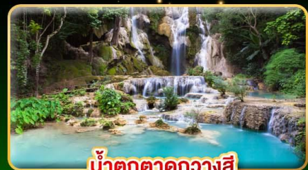
น้ำตกตาดกวางสี