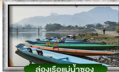
ล่องเรือแม่น้ำซอง