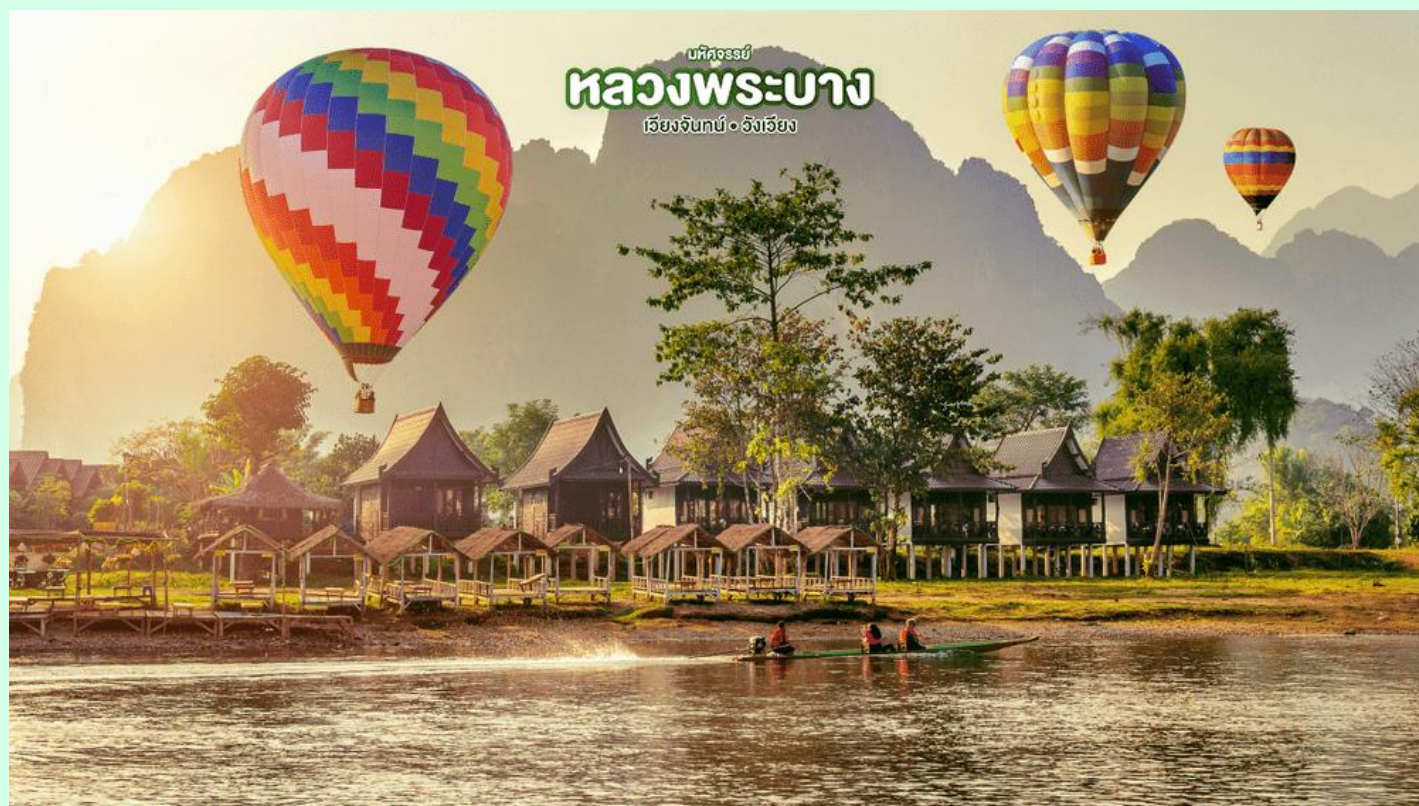
บหัทศจรธย หลวงพระบาง เวียงจันทน์ • จังเวียง

**หมายเหตุ!ในกรณีที่สภาพอากาศไม่เอื้ออำนวยทำให้ไม่สามารถนั่งบอลลูนได้(หากท่านใดสนใจขึ้นบอลลูนรบกวนแจ้งให้ทราบล่วงหน้า)**