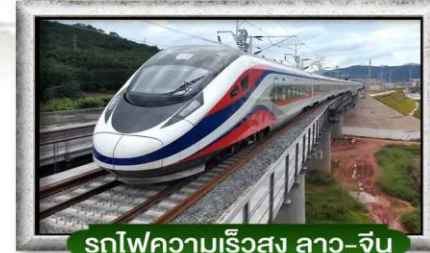
รถไฟความเร็วสูง ลาว-จีน