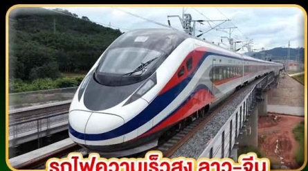
รถไฟความเร็วสูง ลาว-จีน