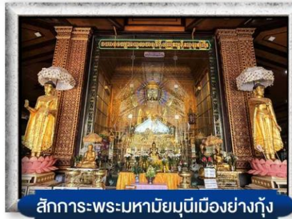
สักการะพระมหาโมกขินี่เมืองย่างกุ้ง