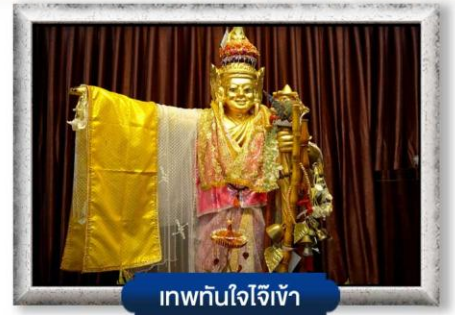
เทพทันใจใจเจ้า