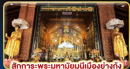
สักการะพระมหาบุญเมืองย่างกุ้ง