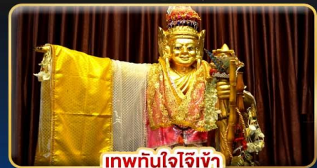
เทพทันใจใจเฝ้า