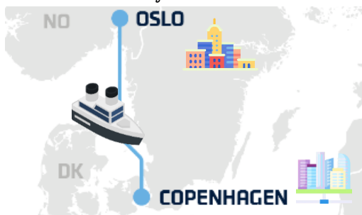
พิเศษ มื้อค่ำ DFDS Buffet Scandinavia