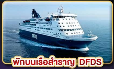
พิกบนเรือสำราญ DFDS