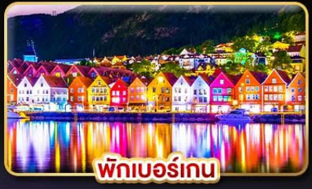
พิกเบอร์เกน