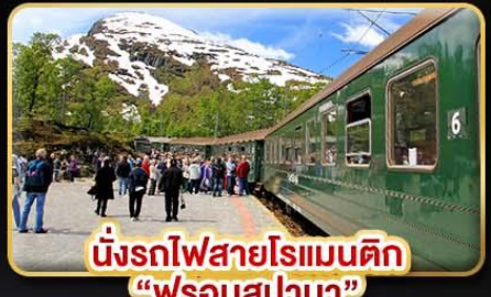
นั่งรถไฟสายโรแมนติก “ฟรอมสปาน่า”