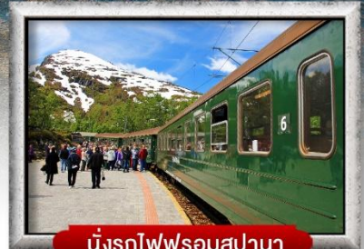
นั่งรถไฟพร้อมสปานา

พิเศษ! พักบนเรือสำราญ แบบ Window Room 2 คืน, พักบ้านแซนต้าคลอส