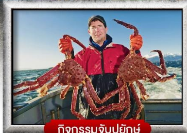
กิจกรรมจับปูยักษ์