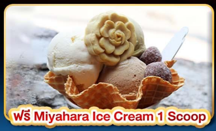
ฟรี Miyahara Ice Cream 1 Scoop

"ขอความรักวัดหลงซาน" ปล่อยคอมลอยเส้นทางรถไฟผิงซี