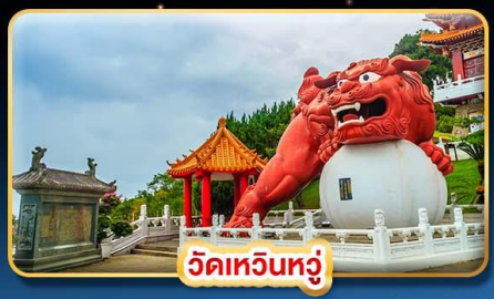
วัดเหวินทง