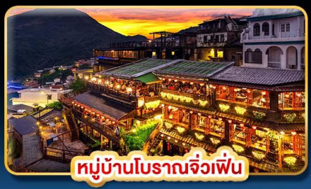
หมู่บ้านโบราณจื่อเฟิน