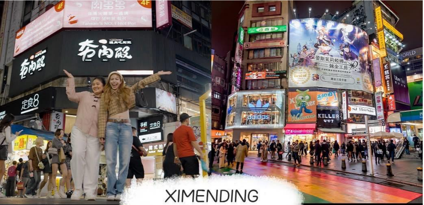
XIMENDING ย่านซีเหมินติง