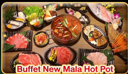
Buffet New Mala Hot Pot Free Flow Beer & Soft Drink