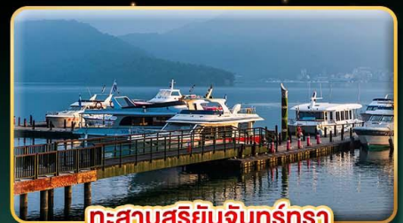
ทะเลสาบสุริยจันทร์ตรา