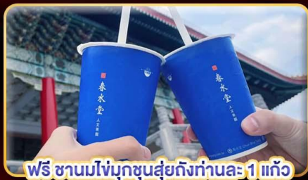
ฟรี ชาวมังโง่ชุนสุ่ยถึงท่านละ 1 แก้ว

เที่ยวใจ เช็กอินจุดไฮไลท์ ปีนบ้าย-กลับตึก