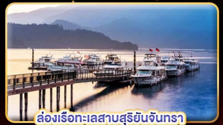
ล่องเรือทะเลสาบสุริยันจันทรา