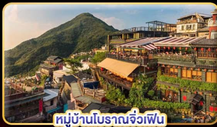
หมู่บ้านโบราณจื่อเฟิน