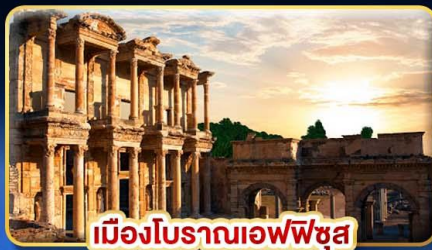
เมืองโบราณเอเฟซุส