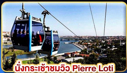
นั่งกระเช้าชมวิว Pierre Loti