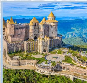
ปราสาทจันทร