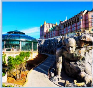
โถง Eclipse Square