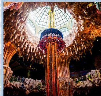
สวนสนุก Fantasy Park