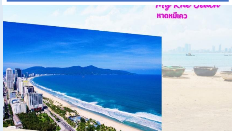
หาดหมีเคว

พาทชมหาดหมีเคว (My Khe Beach) ชายหาดที่สวยงามที่สุดในเมืองดานัง มีแนวโค้งตามลักษณะภูมิประเทศของเวียดนามซึ่งยาวกว่า 32 กิโลเมตร มีหาดทรายสีขาวและเม็ดทรายละเอียด น้ำทะเลสีฟ้าใส ท่านจะได้เพลิดเพลินไปกับธรรมชาติที่สวยงามทั้งวิวภูเขาและอ่าวที่อยู่ตรงข้าม อิสระถ่ายรูปเช็คอินตามอัธยาศัย