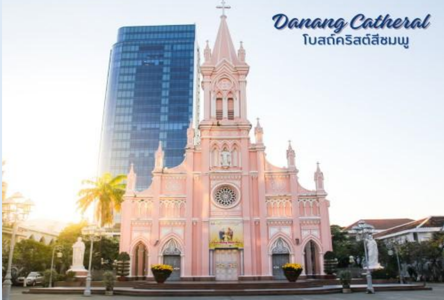
Danang Cathedral โบสถ์คริสต์สีชมพู

นาทานถ่ายรูป โบสถ์คริสต์ดานัง หรือโบสถ์คริสต์สีชมพู (Danang Cathedral) สร้างขึ้นสมัยเวียดนามตกเป็นอาณานิคมของฝรั่งเศส สถาปัตยกรรมสไตล์โกธิก ยตกแต่งด้วยความประณีตสวยงาม ตัวโบสถ์เป็นสีชมพูทั้งหลัง ตัดขอบด้วยสีขาว เป็นอีกหนึ่งสถานที่ที่ไม่ควรต้องพลาดเมื่อมาเยือนเมืองดานัง จากนั้น อิสระช้อปปิ้ง ตลาดฮาน อิสระเลือกซื้อสินค้าหลากหลายชนิด เช่นผ้า เหล้า บุหรี่ และของกินต่างๆ เป็นตลาดสดและขายสินค้าพื้นเมืองของเมืองดานัง