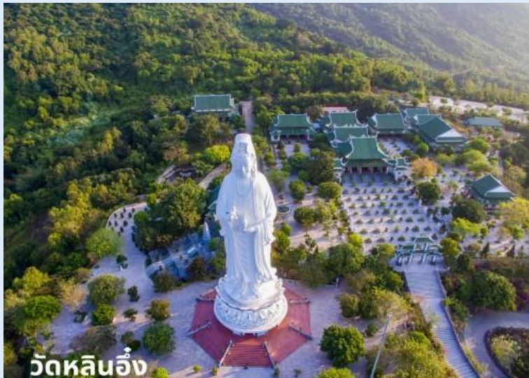
วัดหลินอึ้ง

ได้เวลาอันสมควร นำท่านลงจากเขาบานาฮิลล์ เดินทางสู่เมืองดานัง ระหว่างทางนำท่านแวะร้านหยกและอัญมณี อิสระในการเลือกซื้อสินค้า