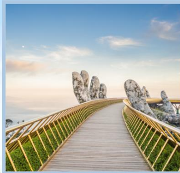
สะพานมือทองคำ