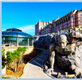
โซอู Eclipse Square