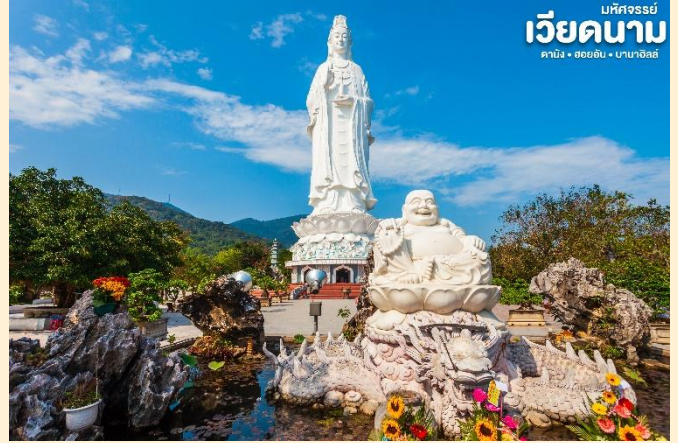
เบคัสจอร์ซี่ เวียดนาม คามิง • ฮอยอัน • ฮานอย

สักการะ วัดลินห์อิง (Linh Ung) เป็นวัดที่ใหญ่ที่สุดของเมืองดานังภายในวิหารใหญ่ของวัดเป็นสถานที่บูชาเจ้าแม่กวนอิมและเทพองค์ต่างๆตามความเชื่อของชาวบ้านแถบนี้นอกจากนี้ยังมีรูปปั้นปูนขาวเจ้าแม่กวนอิมซึ่งมีความสูงถึง 67 เมตรตั้งอยู่บนฐานดอกบัวกว้าง 35 เมตรยื่นหันหลังให้ภูเขาและหันหน้าออกทะเลคอยปกป้องคุ้มครองชาวประมงที่ออกไปหาปลา นอกชายฝั่งวัดแห่งนี้ นอกจากเป็นสถานที่ศักดิ์สิทธิ์ที่ชาวบ้านมากราบไหว้บูชาและขอพรแล้วยังเป็นอีกหนึ่งสถานที่ท่องเที่ยวที่สวยงามเป็นอีกหนึ่งจุดชมวิวที่สวยงามของเมืองดานัง