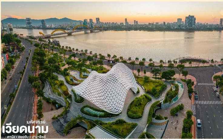
เบคัสจอร์ซี่ เวียดนาม คามิง • ฮอยอัน • ฮานอย

นำท่าน แวะถ่ายรูปที่ Apec Park เป็นสวนสาธารณะริมแม่น้ำฮัน สวนเอเปค สถานที่ท่องเที่ยวแห่งใหม่แห่ง เมืองดานัง บริเวณสวนมีสนามหญ้าขนาดใหญ่ทางเดินปูด้วยหิน สวนหย่อมและยังสามารถมองเห็นแม่น้ำฮัน มีพื้นที่พักผ่อนมากมาย ร้านอาหารของที่ระลึก ร้านอาหาร ร้านกาแฟ ไฮไลท์ของสวน APEC แห่งนี้คือ โดมขนาดยักษ์ที่สร้างจากเหล็ก 200 ตัน มีลักษณะเหมือน "ว่าวยักษ์"