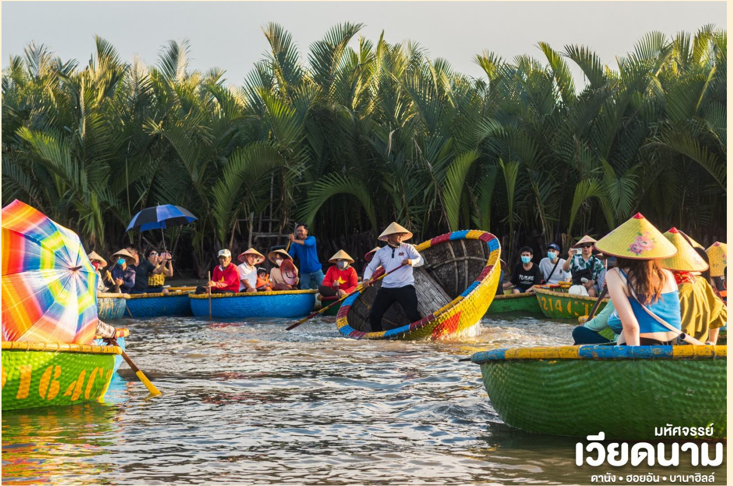
มหัศจรรย์ เวียดนาม ดานัง • ฮอยอัน • บานาฮิลล์