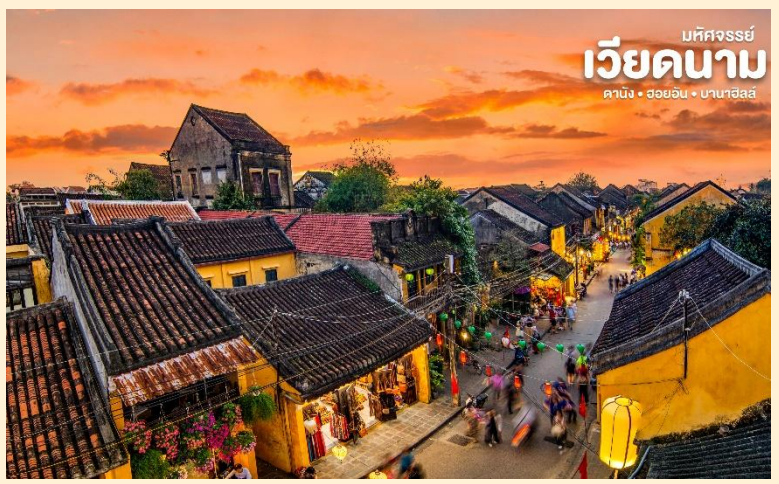
มหัศจรรย์ เวียดนาม ดานัง • ฮอยอัน • บานาฮิลล์

นำท่านเดินทางสู่ “เมืองโบราณ ฮอยอัน” (Hoi An) เมืองฮอยอันนั้นอดีตเคยเป็นเมืองท่า การค้าที่สำคัญแห่งหนึ่งในเอเชียตะวันออกเฉียงใต้และเป็นศูนย์กลางของการแลกเปลี่ยนวัฒนธรรมระหว่างตะวันตกกับตะวันออกการค้ายูเนสโกได้ประกาศให้ฮอยอันเป็นเมืองมรดกโลกทางวัฒนธรรมเนื่องจากเป็นสถานที่สำคัญทางประวัติศาสตร์ แม้ว่าจะผ่านการบูรณะขึ้นเรื่อยๆแต่ก็ยังคงรูปแบบของเมืองฮอยอันไว้ได้ นำท่านเดินทางด้วยรถโค้ชปรับอากาศเดินทางเข้าสู่ตัวเมืองฮอยอัน นำท่านชม วัดจีน เป็นสมาคมชาวจีนที่ใหญ่และเก่าแก่ที่สุดของเมืองฮอยอันใช้เป็นที่พักปะของคนหลายรุ่น วัดนี้มีจุดเด่นอยู่ที่งานไม้แกะสลักกลวดลายสวยงามท่าน สามารถ