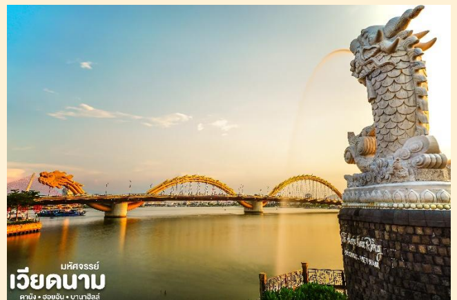
เบคัสจอร์ซี่ เวียดนาม คามิง • ฮอยอัน • ฮานอย

นำท่านชม สะพานมังกร Dragon Bridge อีกหนึ่งที่เที่ยวดานังแห่งใหม่สะพานมังกรไฟ สัญลักษณ์ความสำเร็จแห่งใหม่ของเวียดนามที่มีความยาว 666 เมตร ความกว้างเท่าถนน 6 เลนส์ เชื่อมต่อสองฟากฝั่งของแม่น้ำฮัน ประเทศเวียดนามสะพานมังกรถูกสร้างขึ้นเพื่อเป็นแหล่งท่องเที่ยวดานัง เป็นสัญลักษณ์ของการฟื้นคืนประเทศ และเป็นการฟื้นฟูเศรษฐกิจของประเทศ โดยได้เปิดใช้งานตั้งแต่ปี 2013