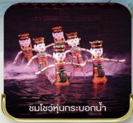
ชมโชว์หุ่นกระบอกน้ำ