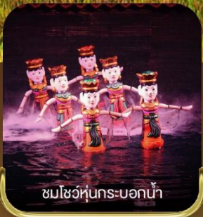
ชมโชว์หุ่นกระบอกน้ำ