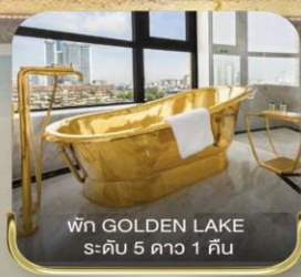
พัก GOLDEN LAKE ระดับ 5 ดาว 1 คืน

Premium Program บินหรู เกี้ยวครบ | 4 วัน 3 คืน