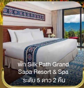
พัก Silk Path Grand Sapa Resort & Spa ระดับ 5 ดาว 2 คืน