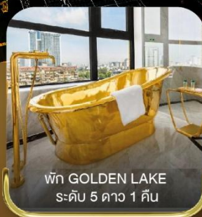
พัก GOLDEN LAKE ระดับ 5 ดาว 1 คืน