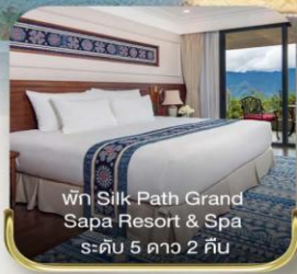
พัก Silk Path Grand Sapa Resort & Spa ระดับ 5 ดาว 2 คืน