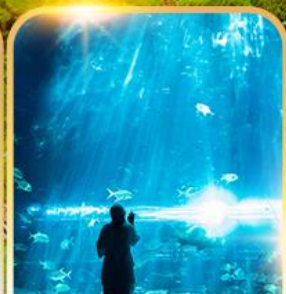
อควาเรียม