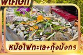
หม้อไฟทะเล+กุ้งมังกร