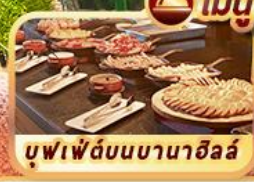
บุฟเฟ่ต์บนบานาฮิลล์