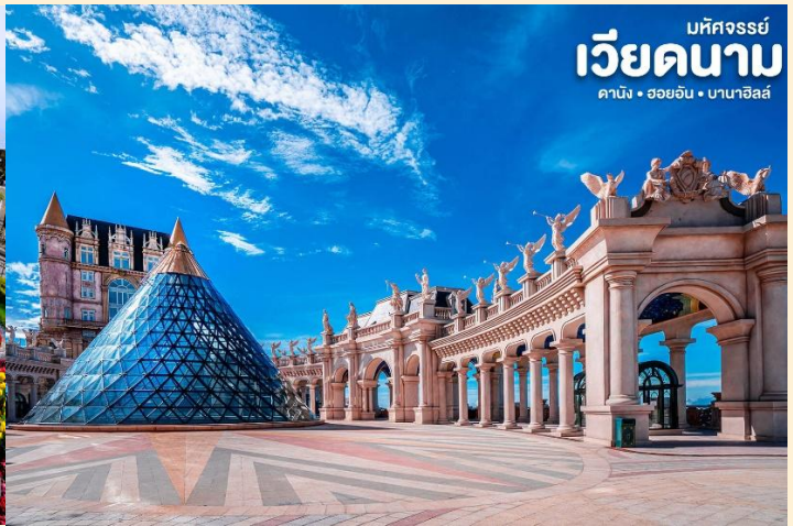
มหัศจรรย์ เวียดนาม ดานัง • ฮอยอัน • บานาฮิลล์