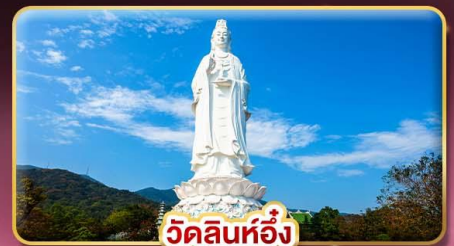
วัดหินห่อัง