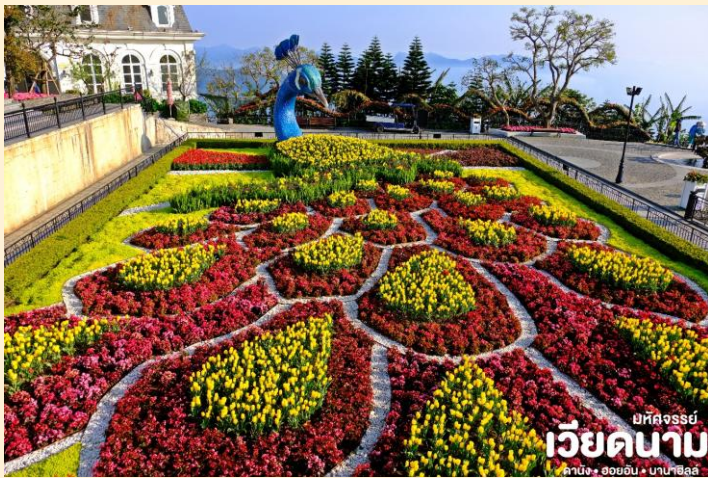
มหัศจรรย์ เวียดนาม ดานัง • ฮอยอัน • บานาฮิลล์