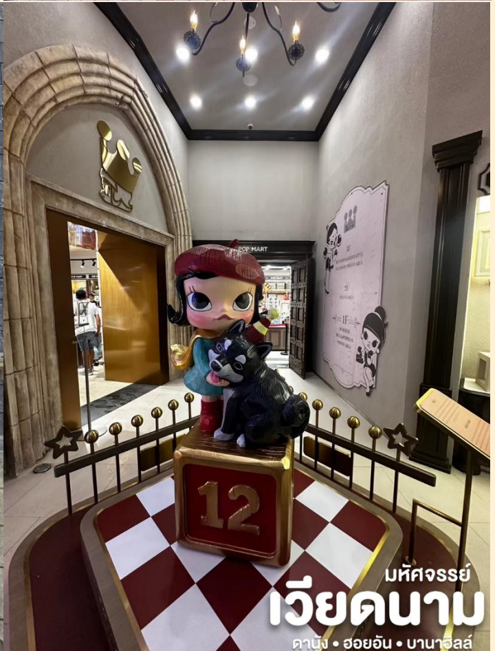
มหัศจรรย์ เวียดนาม ดานัง • ฮอยอัน • บานาฮิลล์

โซนใหม่ Eclipse Square ดินแดนแห่งเทพนิยาย ทางเข้าล้อมรอบด้วยประติมากรรม 20 องค์ของเทพธิดาที่มีชื่อเสียงที่สุดจากเทพนิยายกรีก ตามอธยาศัย และ พบกับ POP MART Ba Na Hills เป็นร้านค้าสาขาใหม่ที่ใหญ่ที่สุดในเอเชียตะวันออกเฉียงใต้ ตั้งอยู่ที่ Ba Na Hills เมืองดานัง ประเทศเวียดนาม เป็นศูนย์รวม Art Toy ที่เป็นกระแสอยู่ตอนนี้ ไม่ว่าจะเป็น Molly,